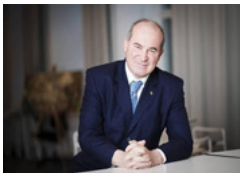
Szalay-Bobrovniczky Vince

„Számos épített örökséggel kapcsolatos tervet sikerült megvalósítani, azonban sok van, amelyeket a vírus miatti kialakult helyzet és anyagi terhek nem tettek lehetővé. Ezeket természetesen később igyekezünk megvalósítani. Jól haladtunk a magyarországi zsidó temetők rekonstrukciójával. (...) Emellett ott vannak a civil ügyek is: számos, a zsidósághoz kötődő civil szervezet támogatása, ilyen például a Tett és Védelem Alapítvány, amely