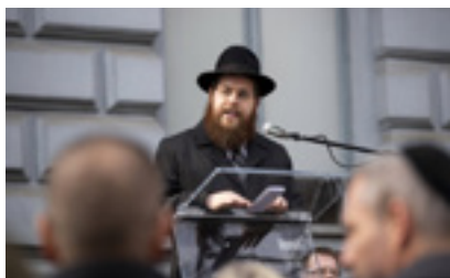
Köves Slomó - forrás: origo.hu/MTI

„Pártpolitikai kérdésekbe nem kívánunk beavatkozni, vallási felekezettől ilyen ügyekben