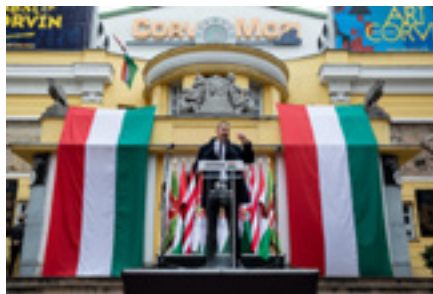
Toroczkai László

A TEV keresi annak jogi – mind büntetjogi, mind polgárjogi vonatkozások- lehetőségét, hogy az ilyen és ehhez hasonló politikusi megnyilatkozásokat miként lehetne csúrájukban elfojtani.