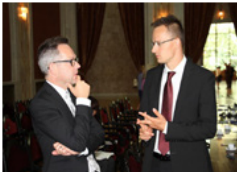
Michael Roth és Szijjártó Péter

Erre a vádra válaszolt Szijjártó Péter a Facebookon: