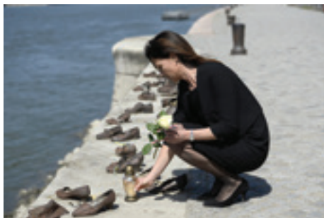
Varga Judit

- a hivatalos megemlékezések kapcsán kifejtette: „Magyarország 1944. március 19. előtt szabad országgént tette a magyar zsidósággal mindazt, amit megcselekedett: a zsidóság fokozatos jogfosztását szolgáló törvényeket egy szabad ország törvénykezése alkotta és szavazta meg.”