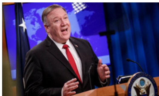
forrás: hirado.hu - (Fotó: EPA/Shawn Thew)

(Itt most mi csak a magyarországi antiszemitizmussal foglalkozó részt ismertetjük.)