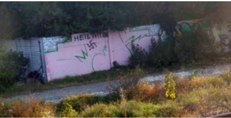
forrás: Tett és Védelem

2018. október 17. Bejelentés érkezett Alapítványunkhoz, hogy Vácott egy magánház kerítésére ismeretlen tettesek horogkeresztet és „HEIL HITLER” feliratot festettek. Mivel a kerítés a Vác-Budapest vasúti vonal mellett helyezkedik el, naponta több ezer ember láthatta azt.