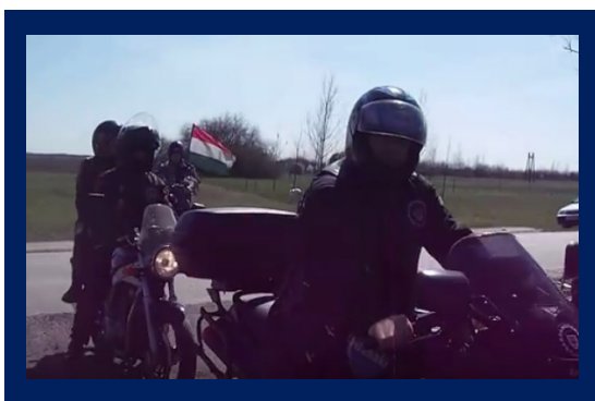
A tiszaeszlári megemlékezés résztvevői

A YouTube csatornára szintén felrakták a megemlékezést, ahol 1017-en nézték meg a videót.