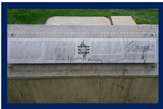
Holokauszttagadó felirat a Március 15-e téren, Forrás: Tett és Védelem Alapítvány

munkatársa menjen a helyszínre és képviselje a sértettet. Alapítványunk munkatársa a helyszínre sietett, a rendőrök rögzítették a nyomokat. Az Alapítvány nevében feljelentést tettünk. A rendőrségi nyomrögzítés után az Alapítvány munkatársa eltávolította a feliratot.