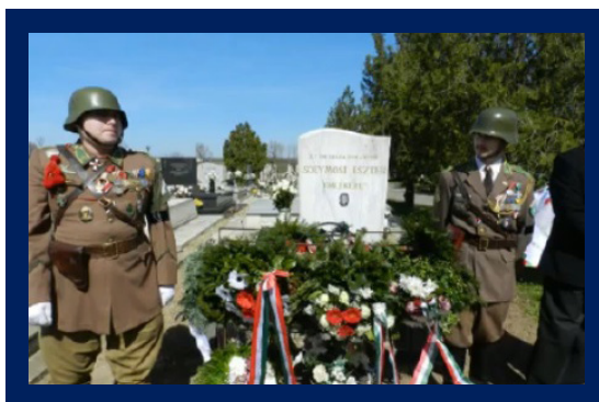
Megemlékezés Tiszaeszláron

Horogkeresztet festettek a Dob utca 31. számú házra