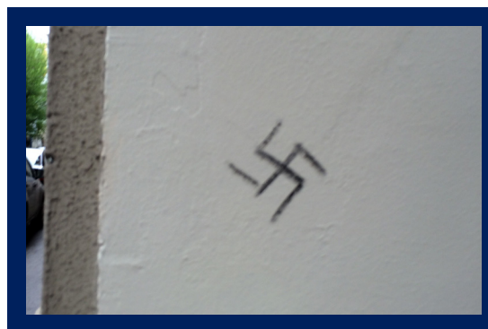
Horogkereszt a ház falán, Forrás: Tett és Védelem Alapítvány

Április 4-én állampolgári bejelentés érkezett az Alapítványhoz, hogy ismeretlen tettesek horogkeresztet festettek Budapesten a VII. kerületben a Dob utca 31. számú ház falára. Az önkényuralmi jelkép eltávolításában az ATID zsidó ifjúsági szervezet tagjai voltak a TEV munkatársainak segítségére.