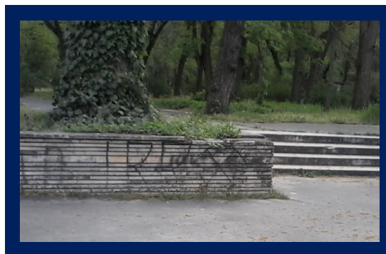
Horogkereszt a Népligetben