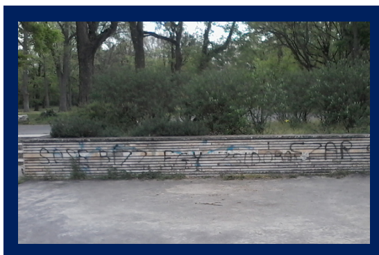
Felirat a Népligetben, Forrás: Tett és Védelem Alapítvány

Április 14-én a Tett és Védelem Alapítvány munkatársa fedezte fel, hogy a Népliget egyik forgalmas helyén zsidókat sértő felirat látható közel 30 cm-es betűkkel. A felirat a következő: „ sose bízz egy zsidóban ”. A szöveg után egy horogkereszt van felfestve.