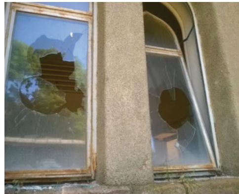
A gyöngyösi zsinagóga betört ablakai.