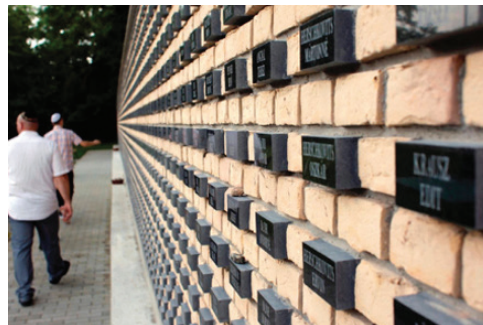
Békéscsabai emlékfal

kell nyújtani „az erőszakkal meggyengített közösségeknek” emlékművek létrehozására, zsinagógák és temetők felújítására. Végül zéró toleranciát kell hirdetni a gyűlöletkeltés és a kirekesztés ellen. Utóbbi a jogrendbe, az új polgári és a büntető törvénykönyvbe is bekerült.