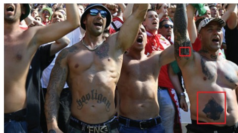
Horogkeresztet tetoválást viselő fociidrukker Bordeaux-ban