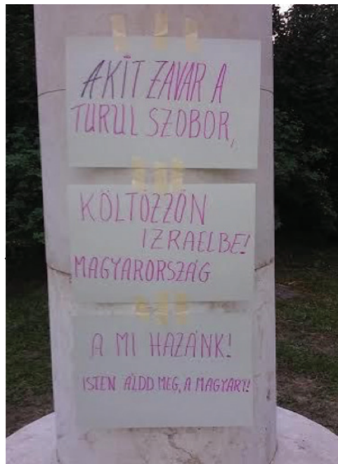
Antiszemita felirat a turulszobor talapzatán.