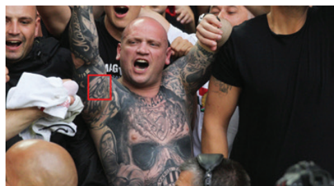
Horogkeresztet tetoválást viselő fociidrukker Bordeaux-ban