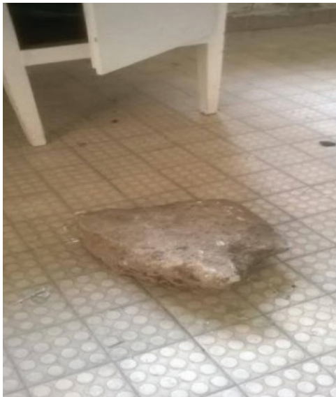
A gyöngyösi zsinagóga ablakán bedobott egyik kő.