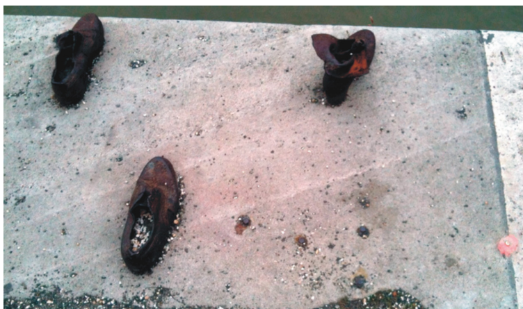
A hiányzó cipők helyét szegecsek jelzik.

Szeptember 6-án adta hírül a Gépnarancs szerkesztősége, hogy a Duna partján található Cipők a Duna-parton emlékműhöz tartozó cipők közül többet is célszerszámmal elloptak.