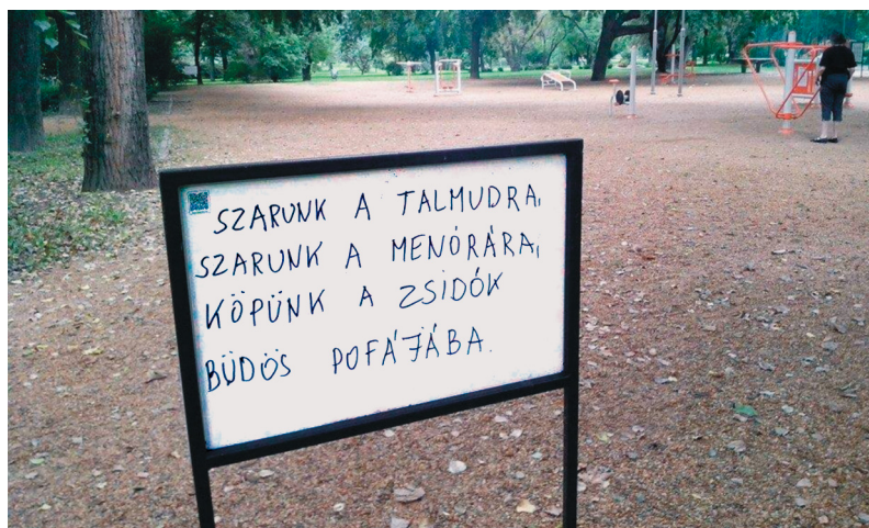
A vérmezei információs tábla.

Szeptember 7-én jelent meg a Fórum az antiszemitizmus ellen Facebook profilján egy kép, amelyet a Vérmezőn készítettek. A képen egy információs tábla hátoldala látható, amire a következő feliratot írták: „Sz*runk a talmudra, sz*runk a menórára, köpünk a zsidók bűdös pofájába.”