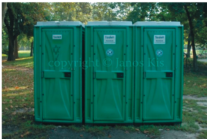
A kihelyezett vécén található Dávid csillag.