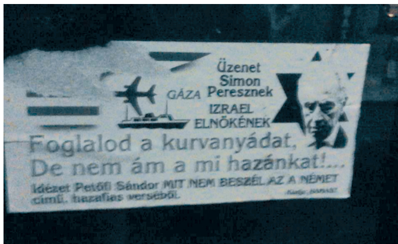
Az antiszemita matrica.

Szeptember 8-án készült kép tanúsága szerint a HAMASZ Magyarországon is üzent Petőfi Sándor költő szavaival Simon Peresznek, Izrael volt elnökének: „Foglalod a kurvanyádat, De nem ám a mi hazánkat! ...” (szöveghű idézet) Az elnök arcképét, egy hatágú fekete csillagot és Gáza feliratot is tartalmazó matricát a Paulay Ede utcában, az Izraeli Kulturális Intézet melletti irodaházon fényképezték.