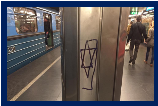
A Deák Ferenc téri metrómegállónál található akasztott Dávid-csillag.

Május 4-én osztotta meg a Fórum az antiszemitizmus ellen Facebook profilján azokat a képeket, amelyeken két Dávid-csillag látható. Az egyik képen az M3-as metróvonal Deák Ferenc téri megállójának egyik oszlopára rajzolt akasztott Dávid-csillag szerepel, míg a másik képen az M3-as metróvonalon közlekedő egyik szerelvény ajtajára rajzolt akasztott Dávid-csillag látható.