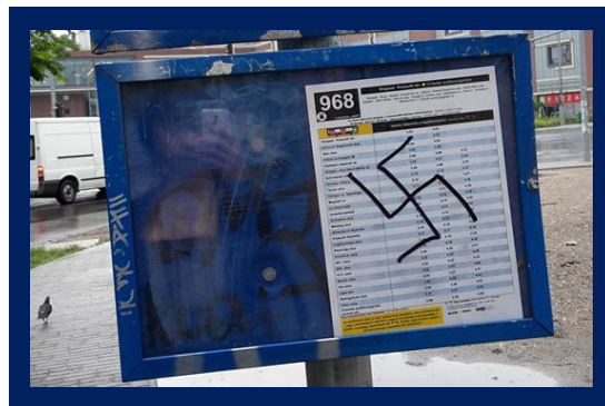
A menetrenden található horogkereszt

Kispest tömegközlekedési csomópontnál a 968-as éjszakai járat menetrend táblájára ismeretlen elkövető egy horogkeresztet rajzolt.