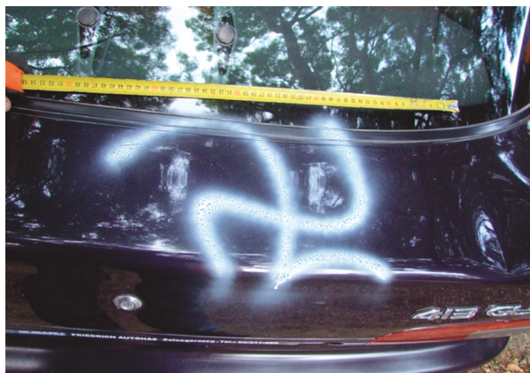
A személygépkocsikra rajzolt nem-horogkeresztek