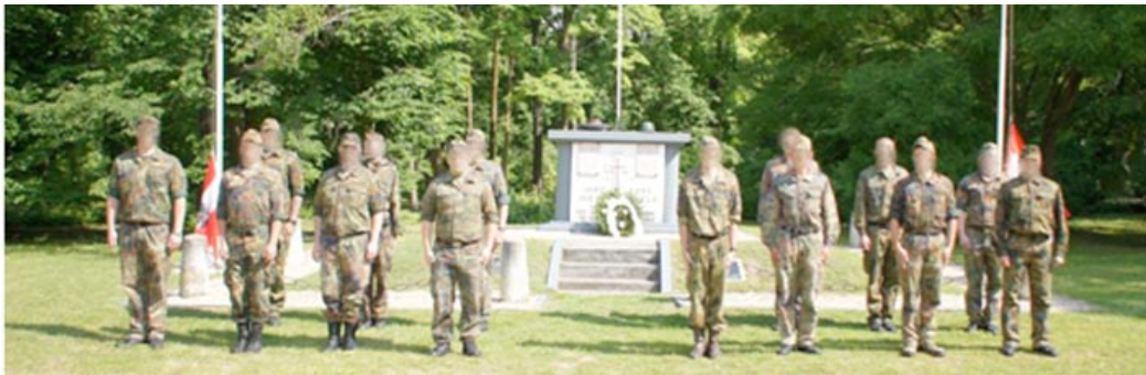
Hősök napja – a Nemzeti Arcvonal egyenruhás felvonulása

A Tett és Védelem Alapítvány vizsgálja a rendezvénnyel kapcsolatban feltételezett jogsértések elleni fellépés lehetőségét.