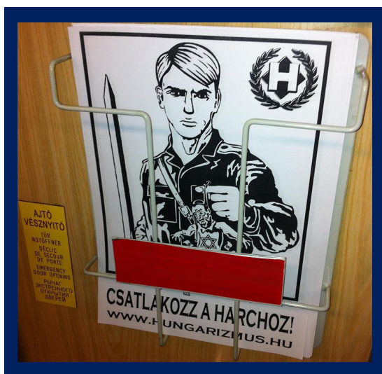
2013 novemberében a BKK egyik járművén is feltűnt a fent leírt plakát, Forrás: Tett és Védelem Alapítvány

A Siklósi Járásbíróság 2014 októberében közösség tagja elleni erőszak elkövetéséért próbára bocsátotta és pénzbüntetéssel sújtotta az elkövetőket, azonban figyelmen kívül hagyta, hogy a büntetett hárman követték el, aminek alapján az csoportosan elkövetett minősítést kaphatott volna. Ebben az esetben az elkövetőkkel szemben nem alkalmazhattak volna próbára bocsátást és pénzbüntetést, csakis letöltendő vagy felfüggesztett börtönbüntetést. Miután az ügyész nem fellebbezett, ezért bár a másodfokon eljáró bíróság az elsőfokú ítélet minősítését csoportosan elkövetett büntetettre változtathatta, amelyet meg is tett, azonban az elsőfokú ítéletet súlyosítani nem tudta. A Pécsi Törvényszék helybenhagyta a N. Z.-re kiszabott 90 ezer forintos pénzbüntetést. A másik két elkövető büntetéséről nem rendelkezünk információkkal.