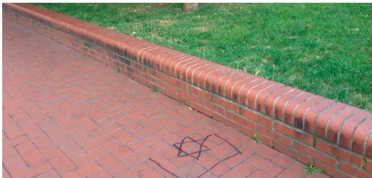
A felrajzolt Dávid csillag.

Július 26-án, a másnapi bejelentett Izrael párti tüntetés idejére időzítve ismeretlen elkövetők akasztott Dávid csillagot rajzoltak a Dohány utcai Zsinagóga előtti Herzl Tivadar park járdájára.