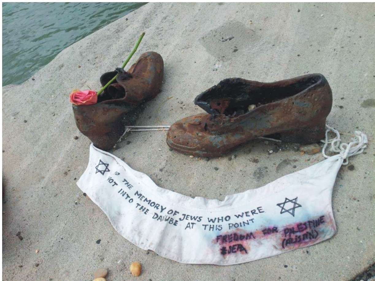
„Freedom for Palestine” felirat a Cipőknél.

Július 31-én közölt egy képet Twitter oldalán a Fórum az antiszemitizmus ellen a Cipők a Duna-parton emlékműről, amelyen ismeretlen elkövetők meggyalázták az ott elhelyezett textildarabot. A szövetre a „FREEDOM FOR PALESTINE” (szöveghű idézet) feliratot írták fel.