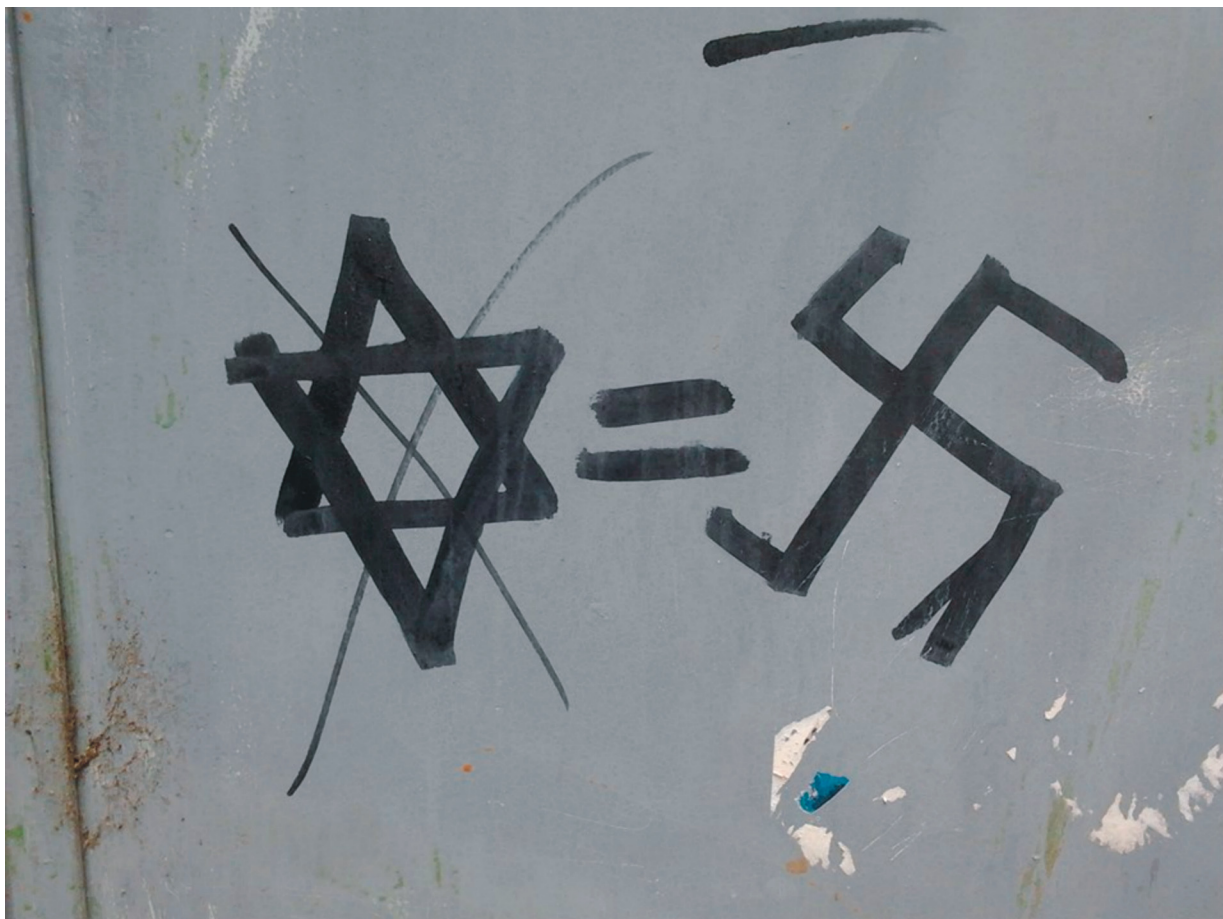
Falfirka a Fehérvári úton.

A Fórum az antiszemitizmus ellen Facebook profilján július 28-án tett közzé egy olyan fényképet, amelyet a Fehérvári úton fényképezett egy önkéntes. A fényképen egy áthúzott Dávid csillag és egy horogkereszt látható, közöttük egy egyenlőség jellel.