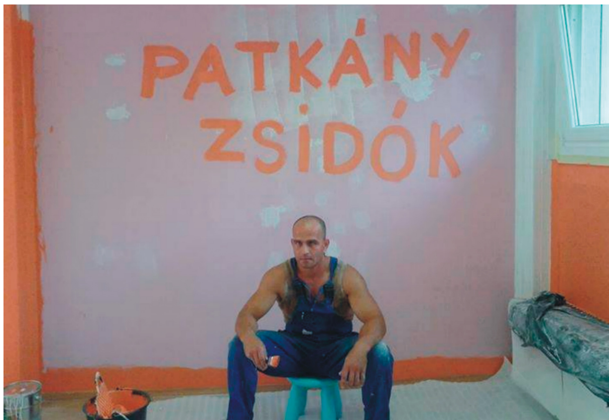
„Patkány zsidók” felirat az óvodában.