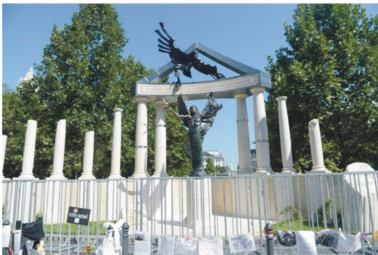
A német megszállás emlékműve.

Július 19-én éjszaka beemelték a helyükre a német megszállás áldozatainak emlékére állított emlékmű részeit.