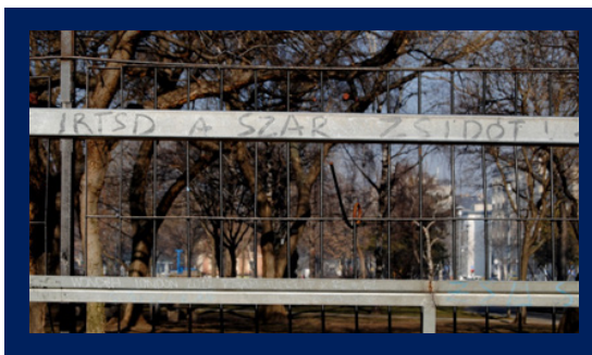
A Nehru parti futballkapu

A !!444!!! internetes portálon február 17-én tették közzé Ács Dániel, egyik újságírójuk cikkét, melyben a XI. kerületben található két játszótér rossz állapotáról ír. A hibás eszközök és veszélyes környezet mellett említést tett arról, hogy a Nehru parton található, ráccsal körülvett, kis futballpálya mindkét kapujára az „Irtsd a szar zsidót!” (szöveghű idézet) szöveget írták.