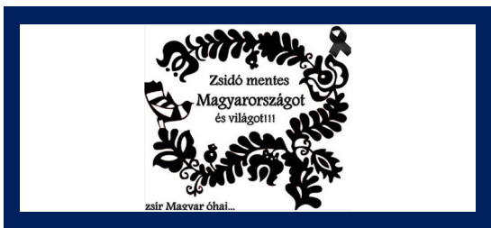
A Magyar népmeséket idéző kép