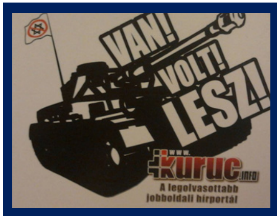
A kuruc.infot népszerűsítő matrica, Forrás: Fórum az antiszemitizmus ellen

Gazdasági Főiskola területén található matricát mutat. A matricán egy tank látható, amelyen egy pirossal áthúzott Dávid-csillagos lobogó van. A tank mellé pedig a „Van! Volt! Lesz!” szöveget írták.