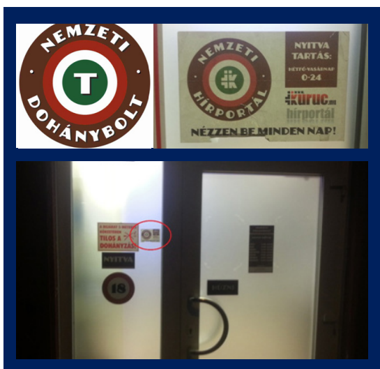
A képeken látható a Nemzeti Dohánybolt és a Nemzeti Hírportál „logója” közötti hasonlóság.

Február 2-án a Tett és Védelem Alapítvány munkatársa egy kuruc.info portált hirdető matricát fényképezett a Budapest III. kerületi, Zemplén Győző utcában található Nemzeti Dohánybolt bejárata melletti üvegén. A matricán a kuruc.info portált – a Nemzeti Dohánybolt logójának stílusjegyeit felhasználva – „Nemzeti Hírportál”-nak aposztrofálják, valamint buzdítanak, hogy „Nézzén be minden nap!”